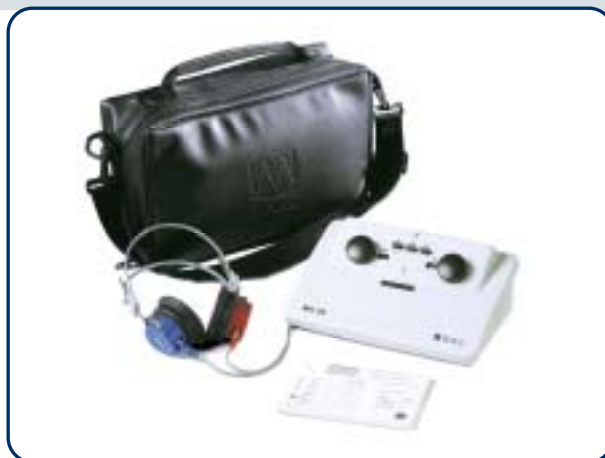
MA 25 mit Zubehör und Tragetasche

Das MA 25 bietet vier verschiedene Testsignale: Dauerton, Pulston, Wobbelton und pulsierender Wobbelton. Es stehen 10 Testfrequenzen von 250 Hz bis 8000 Hz mit Pegeln von -10 dB HV bis 90 dB HV zur Verfügung.