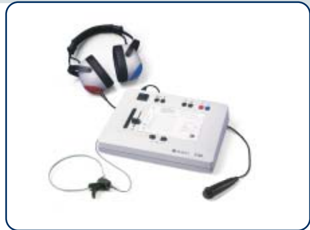
ST 20 KL mit Knochenleitungshörer und Patiententaste