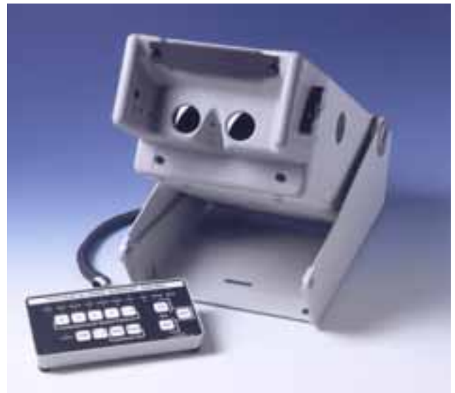
Sehtestgerät T2s als manuelle Variante

email: vertrieb@maico-diagnostic.com Internet: www.maico-diagnostic.de